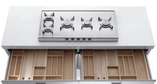
Piano cottura ribaltabile con cinque fuochi a gas in linea, top in Corian®, cassetti attrezzati. Flip-up hob with five aligned gas burners, Corian® countertop, accessorized drawers.