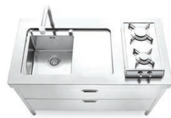
Top inox con lavello integrato, piano cottura ribaltabile a gas, due cassetti inox. Stainless steel countertop with integrated sink, flip-up gas hob, two stainless steel drawers.