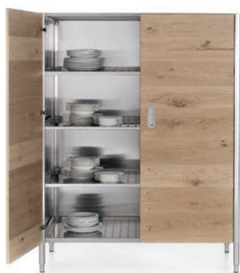
Colonna con ante in legno per contenimento, ripiani inox regolabili in altezza. Column with wooden doors for storage, stainless steel shelves adjustable in height.