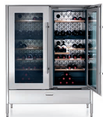
Colonna doppia cantina frigo, cassetto inox. Column with double refrigerator-wine cellar, stainless steel drawer.