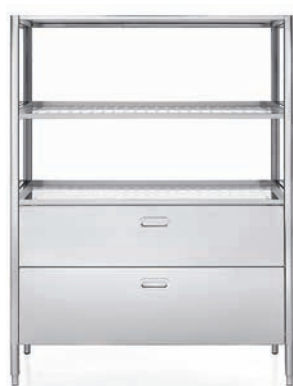
Colonna contenimento, ripiani e cassetti inox. Storage column, with stainless steel shelves and drawers.