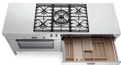
Piano cottura con cinque fuochi a gas, griglia in ghisa, comandi frontali, top inox. Grande forno elettrico e cassetti attrezzati. Hob with five gas burners, cast iron grids, front controls, stainless steel countertop. Large electric oven and accessorized drawers.