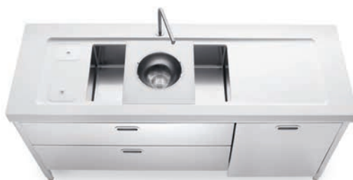
Vasca sottopiano, top in Corian®, due cassetti e anta per lavastoviglie inox, raccolta differenziata. Undermounted sink, Corian® countertop, two drawers and one dishwasher panel in stainless steel, separated waste disposal system.