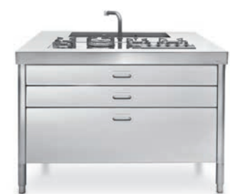
Top inox con vasca e piano cottura integrati, cassetti inox su ambo i lati. Stainless steel countertop with integrated sink and hob, stainless steel drawers on both sides.