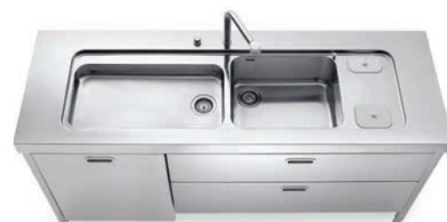
Lavello integrato al top inox con raccolta differenziata dall'alto, due cassetti e anta per lavastoviglie inox. Sink integrated into the stainless steel countertop with separated waste disposal from above, two drawers and a dishwasher panel in stainless steel.