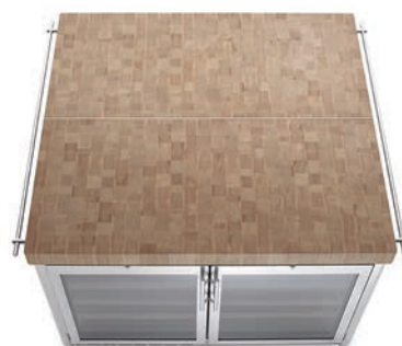
Top in legno massello, cantine frigo. Solid wood countertop, refrigerator-wine cellars.