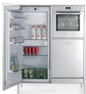
Colonna inox frigo, forno e lavastoviglie. Stainless steel column with refrigerator, oven and dishwasher.