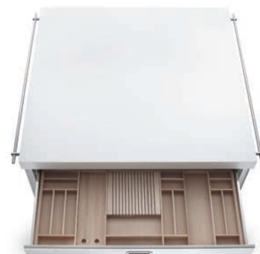
Top in Corian®, cassetti attrezzati su ambo i lati, ripiano inox fisso. Corian® countertop, accessorized drawers on both sides, fixed stainless steel shelf.