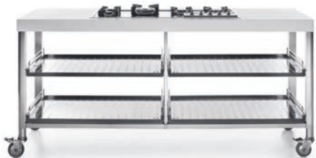
Piano cottura ad incasso e quattro ripiani estraibili inox. Built-in hob and four stainless steel pull-out shelves.