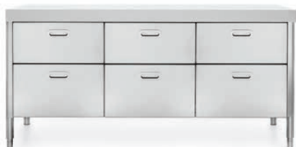
Top in Corian®, sei cassetti inox. Corian® countertop, six stainless steel drawers.