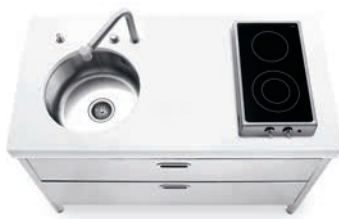
Top in Corian®, vasca tonda sottopiano, piano cottura ribaltabile ad induzione, due cassetti inox e raccolta differenziata. Corian® countertop, undermounted round sink, flip-up induction hob, two stainless steel drawers and separated waste disposal system.