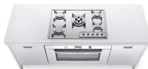
Piano cottura ad incasso con cinque fuochi a gas, top in Corian®, grande forno elettrico, due ante inox. Built-in hob with five gas burners, Corian® countertop, large electric oven, two stainless steel doors.