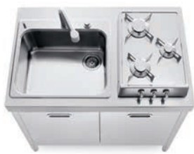
Top inox, vasca ad incasso, piano cottura ribaltabile a tre fuochi, due ante inox. Stainless steel countertop, built-in sink, flip-up hob with three burners, two stainless steel doors.