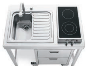
Top inox, lavello ad incasso, piano cottura ribaltabile ad induzione, carrello sotto top. Stainless steel countertop, built-in sink, flip-up induction hob, trolley under the counter.