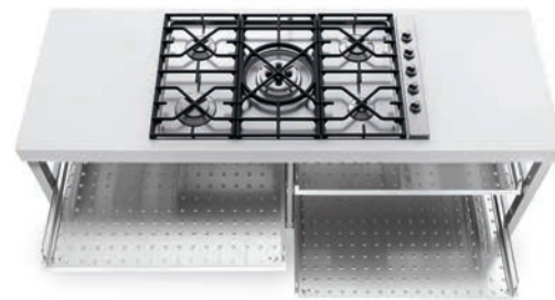
Piano cottura ad incasso con cinque fuochi a gas, griglia in ghisa, comandi laterali e quattro ripiani estraibili inox. Built-in hob with five gas burners, cast iron grids, side controls and four stainless steel pull-out shelves.