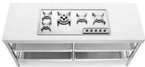
Piano cottura ad incasso con cinque fuochi a gas in linea e quattro ripiani estraibili inox. Built-in hob with five aligned gas burners and four stainless steel pull-out shelves.