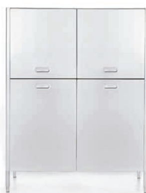
Colonna inox a quattro ante per contenimento. Stainless steel four-door storage column.