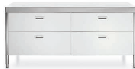
Top inox, quattro cassetti in laccato bianco. Stainless steel countertop, four painted-white wood drawers.