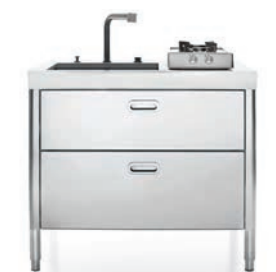
Top in Corian®, vasca, piano cottura ribaltabile, due cassetti inox e raccolta differenziata. Corian® countertop, sink, flip-up hob, two stainless steel drawers and separated waste disposal system.