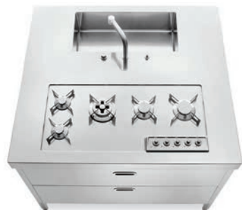
Top inox con vasca integrata, piano cottura integrato con cinque fuochi a gas in linea, cassetti inox su ambo i lati. Stainless steel countertop with integrated sink, integrated hob with five aligned gas burners, stainless steel drawers on both sides.