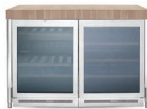
Top in legno massello, doppia cantina frigo. Solid wood countertop, double refrigerator-wine cellar.