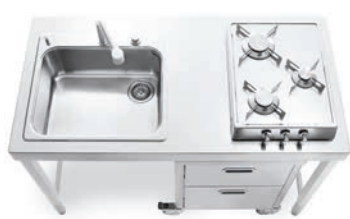
Top inox, vasca ad incasso, piano cottura ribaltabile a tre fuochi, carrello sotto top. Stainless steel countertop, built-in sink, flip-up hob with three burners, trolley under the countertop.