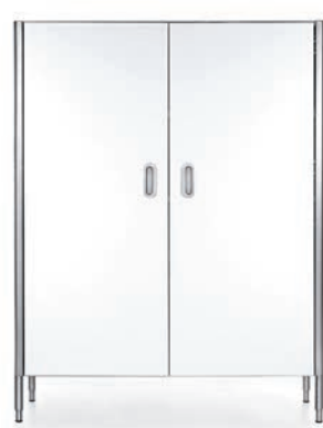
Colonna con ante in laccato bianco per frigo e/o contenimento. Column with painted-white wooden doors, for refrigerator and/or storage.