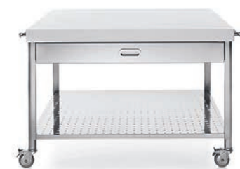
Top in Corian®, cassetti attrezzati su ambo i lati, ripiano inox fisso. Tutto su ruote. Corian® countertop, accessorized drawers on both sides, fixed stainless steel shelf. Entire unit on wheels.