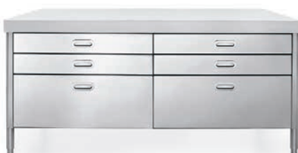
Top in Corian®, sei cassetti inox. Corian® countertop, six stainless steel drawers.