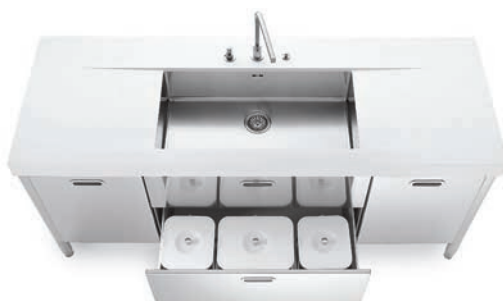
Vasca sottopiano, top in Corian®, due ante e due cassetti inox, raccolta differenziata. Undermounted sink, Corian® countertop, two stainless steel doors and drawers, separated waste disposal system.