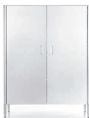
Colonna con ante inox per frigo e/o contenimento. Column with stainless steel doors for refrigerator and/or storage.