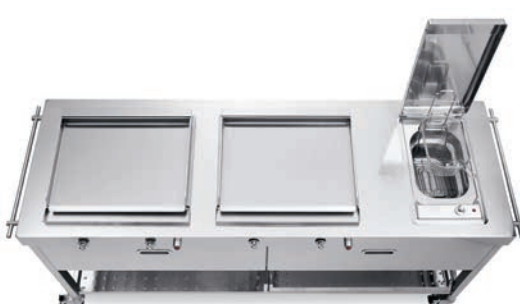
Carrello con top inox, due piastre cottura inox a gas, friggitrice elettrica. Trolley with stainless steel countertop, two stainless steel gas planchas, electric fryer.