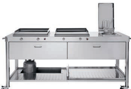
Carrello con top inox, piastra cottura inox a gas, friggitrice, due cassetti inox, ripiano estraibile e porta bombola. Trolley with stainless steel countertop, one stainless steel gas plancha, fryer, two stainless steel drawers, a pull-out shelf and gas cylinder storage.