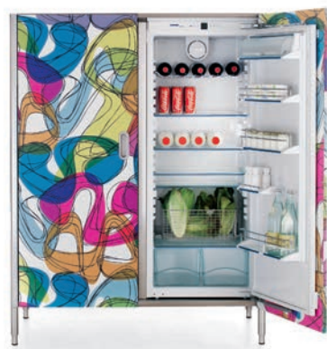
Colonna con ante in laminato per frigocongelatore e/o contenimento. Column with laminate-finish doors, for refrigerator-freezer and/or storage.