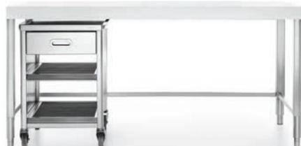
Carrello sotto top con un cassetto e due ripiani estraibili inox. Trolley under the counter with one drawer and two pull-out shelves in stainless steel.