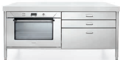
Forno elettrico multifunzione con porta fredda, tre cassetti inox. Multifunction cold-door electric oven, three stainless steel drawers.