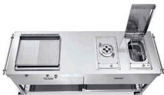
Carrello con top inox, piastra cottura inox a gas, piano cottura fuoco singolo con tripla corona, friggitrice elettrica. Trolley with stainless steel countertop, stainless steel gas plancha, hob with one gas triple-crown burner, electric fryer.